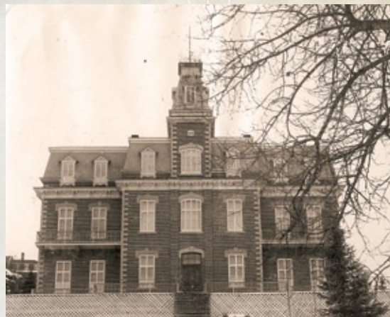
L'évêché de Chicoutimi détruit en 1955