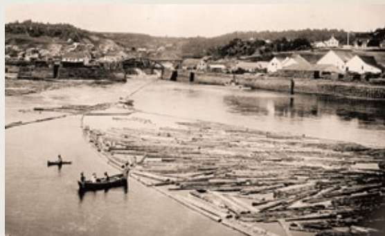
Vers 1892, le bois flottant sur le bassin est destiné à la scierie Price, visible à l'arrière plan

Cette maison, qui s'apparente aux demeures rurales traditionnelles de la vallée du Saint-Laurent, est l'un des rares vestiges de l'époque de la scierie Price au Bassin. L'édifice érigé vers 1870 abritait l'un des premiers magasins ainsi que les bureaux administratifs de la Price Brothers Company au Saguenay. À cette époque, les employés de Price et McLeod étaient payés en « pitons » échangeables contre de la marchandise au seul magasin de la compagnie. En 1851, la scierie du Bassin emploie 120 employés et produit environ 3000 madriers par jour. La coupe du bois connaîtra cependant un déclin marqué à la fin du XIX e siècle. La scierie ferme définitivement ses portes en 1901, cédant sa place à l'industrie naissante de la pâte à papier.