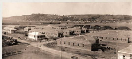
Le camp d'entraînement militaire sur la zone portuaire pendant la Seconde Guerre mondiale

Société des remorqueurs du Saint-Laurent. Le Hangar N° 2, dernier témoin de la vocation portuaire de Chicoutimi, fut construit en 1932. L'édifice a été rénové en 2005 par la Ville de Saguenay en conservant certains éléments caractéristiques, dont la tour utilisée à l'époque par la capitainerie. Durant la Seconde Guerre mondiale, les terrains du port de Chicoutimi furent utilisés pour entraîner les nombreuses recrues de la conscription (Camp Tremblay). Les activités portuaires ont été démenagées dans les années 1980. À l'occasion du 150 e anniversaire de Chicoutimi en 1992, un parc très populaire a été aménagé sur son emplacement.