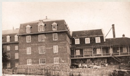
L'Hôtel-Dieu Saint-Vallier en 1893. La partie la plus ancienne, reconnaissable à sa galerie, abritait à l'origine l'hôpital de la marine. Ces bâtiments sont incendiés en 1963

Ce bâtiment date de 1939. C'est en 1974 que le Grand Séminaire de Chicoutimi s'y installe définitivement, suite au déménagement de l'école d'agriculture à l'Université du Québec à Chicoutimi. Les architectes Léonce Desgagné et Armand Gravel fournissent ici un des rares exemples du style Dom Bellot à Chicoutimi.