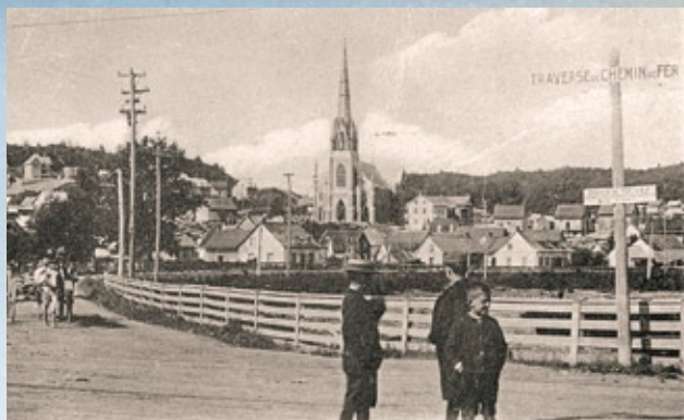
L'église du Sacré-Cœur, avant la construction du presbytère. À droite, la célèbre « petite maison blanche »