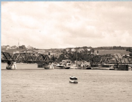
Le pont de Sainte-Anne en construction

En 1968, le pont de Saint-Anne ne suffit plus à la demande croissante des voitures. C'est alors que débute la construction du pont Dubuc, inauguré en octobre 1972. Le pont de Sainte-Anne accueille désormais les piétons et cyclistes.