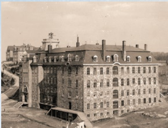
Le séminaire de Chicoutimi avant le feu de 1912

dont la sienne, au 321, typique du mouvement architectural Arts and Crafts . Depuis 1989, l'ensemble de la rue du Séminaire et de ses bâtiments a été constitué en « site du patrimoine » par l'ancienne ville de Chicoutimi.