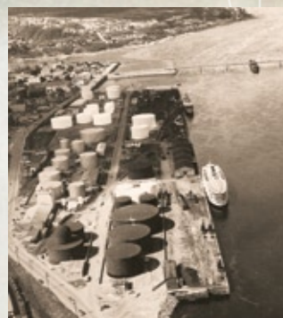
Les réservoirs sur le port de Chicoutimi vers 1963.