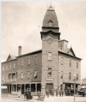
Le premier hôtel de ville de Chicoutimi, démoli en 1932

En jetant un coup d'œil vers la rue de l'Hôtel-de-Ville, on remarque en haut de la côte l'élégant bureau édifié vers 1908 en l'honneur du notaire T.-Z. Cloutier, avec ses colonnes et son fronton néoclassiques. Plus haut, on aperçoit le monastère et la chapelle du Très-Saint-Sacrement.