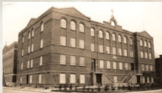
L'académie commerciale avant 1960. Derrière, l'annexe accueille aujourd'hui l'Hôtel du Fjord