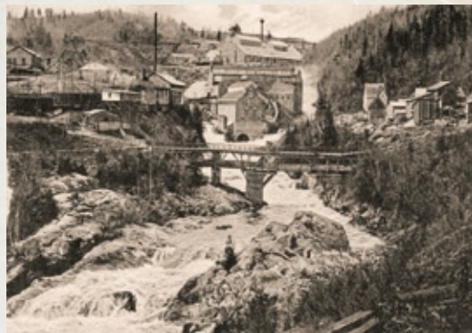
La Compagnie de pulpe de Chicoutimi

Lourdement touchée par le déluge de 1996, la Pulperie entreprend d'importants travaux. Le site abrite désormais le musée régional du Saguenay-Lac-Saint-Jean et la Maison Arthur-Villeneuve. Le nouveau musée a ouvert ses portes en 2002.