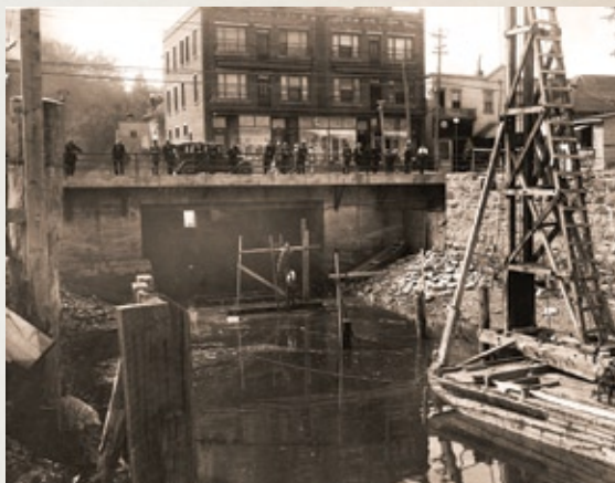
Sous l'actuelle rue de l'Hôtel-de-Ville, coulait jadis la rivière aux Rats, canalisée en 1929 (BAnQC, SHS, P2/7-03-1-p01)

Au coin des rues Racine et Morin se trouvait, jusqu'en 1960, l'ancienne Académie commerciale, œuvre du prolifique architecte René-Pamphile Lemay. Construite en 1907, l'Académie, dirigée par les Frères Maristes, fut prolongée en 1930 d'une annexe encore présente aujourd'hui, transformée en hôtel en 1961. En 1942, l'Académie commerciale accueillait 21 classes de garçons de la 7 e à la 12 e années. L'Hôtel du Fjord a fait l'objet d'une restauration en 1997, mettant en valeur l'aspect originel du bâtiment.