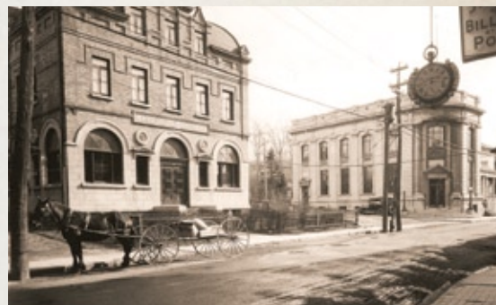
La Banque Molson et la Banque canadienne nationale en 1925