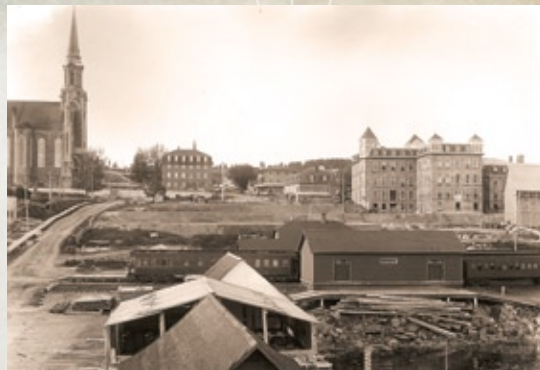
La première cathédrale de Chicoutimi était orientée vers l'ouest. À sa droite, le premier couvent des Sœurs du Bon-Pasteur, incendié en 1912

Le développement rapide de Chicoutimi, autant sur le plan industriel que sur le plan commercial, amène bientôt à Chicoutimi une forte concentration d'institutions d'envergure régionale : l'évêché, le palais de justice, le séminaire et le collège classique, l'hôpital, les couvents, la prison confirment la vocation régionale de Chicoutimi. Plusieurs de ces institutions se sont concentrées au sein du quartier Est de Chicoutimi, sur les hauteurs de la ville. Fortement touché par l'incendie de 1912, le quartier préférera ensuite la brique et la pierre, plus solides et reflétant mieux son rôle institutionnel.