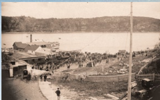
Inauguration du chemin de fer en 1893 (BAAnQC, SHS, P2/2991)