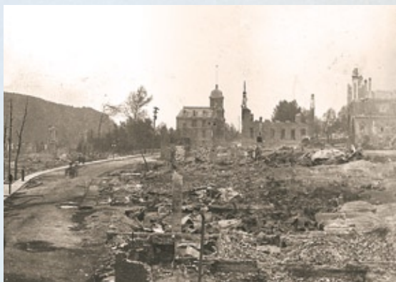
La rue Racine dévastée après le feu de 1912, seul le bureau de poste demeure intact

Le « haut de la rue Racine » rend clairement compte de la prospérité commerciale du centre-ville de Chicoutimi dans les années 1940, 1950 et 1960. C'est à cette époque où l'Art déco a la faveur des architectes que se construisent les édifices commerciaux de cette section de la rue Racine. Plusieurs exemples témoignent avec éloquence de cette vogue. L'édifice William-Tremblay au 363 (à remarquer les allèges en fonte et l'escalier intérieur), l'ancienne Banque provinciale du Canada au 387, l'ancien magasin Gagnon et frères au 400 (à noter les splendides bas-reliefs de fonte et la devanture noire du rez-de-chaussée, entièrement couverte de vitrolite).