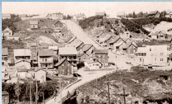
La côte Saint-Ange vers 1920