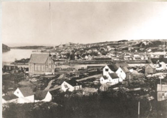
Le site du poste de traite en 1896. La chapelle sera détruite en 1930

Le secteur boisé entre le boulevard du Saguenay et la rue Price est le véritable berceau de la ville. La présence amérindienne sur ce site remonte à plusieurs millénaires avant Jésus-Christ. C'est ici que fut établi dès 1676 le poste de traite de Chicoutimi. Territoire de chasse protégé dont les revenus sont exclusifs au Roi, la région compte plusieurs postes de traite destinés au commerce des fourrures avec les Amérindiens. Celui de Chicoutimi en est l'un des plus anciens et des plus prospères. Une première chapelle y est construite en 1676 et incendiée quelques années plus tard. Une seconde chapelle la remplace en 1726 et restera en place jusqu'en 1856, année de sa démolition. En 1750, le site du poste de traite regroupe une dizaine de bâtiments, dont la chapelle, le magasin et la maison du commis. Une dernière chapelle est érigée en 1893. Celle-ci ne sera démolie qu'en 1930. Désigné lieu historique national en 1972 et classé site historique en 1984, le site du poste de traite a fait récemment l'objet de fouilles archéologiques et n'a pas encore révélé tous ses secrets.