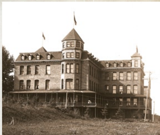
Le château Saguenay, où se déclencha le grand feu du 24 juin 1912

Fondé en 1899, l'Hôtel Chicoutimi a été agrandi, reconstruit et rénové à plusieurs reprises. Son aspect actuel révèle le passage de nombreux architectes : le bâtiment d'origine de R.-P. Lemay, dont certaines chambres subsistent, le pavillon arrondi au coin de la rue Salaberry (Lamontagne et Gravel, 1960), l'agencement coloré de la façade (Gravel et Gravel, 1969) et finalement la corniche, ajoutée lors des grandes rénovations du 100 e anniversaire.